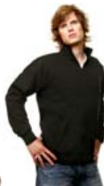
Partnerprodukt SWEATS | 1302 | S.124